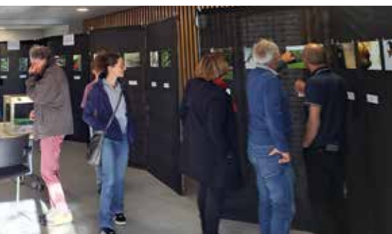
Les visiteurs découvrent l'exposition

● Le thème choisi « Un territoire remarquable et fragile à protéger » a inspiré nombre de photographes. Le